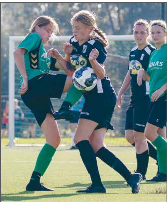
Bij clubs uit de buurt viel het al niet meer op dat er bij Sleeuwijk ook een meisje meedeed bij de jongens