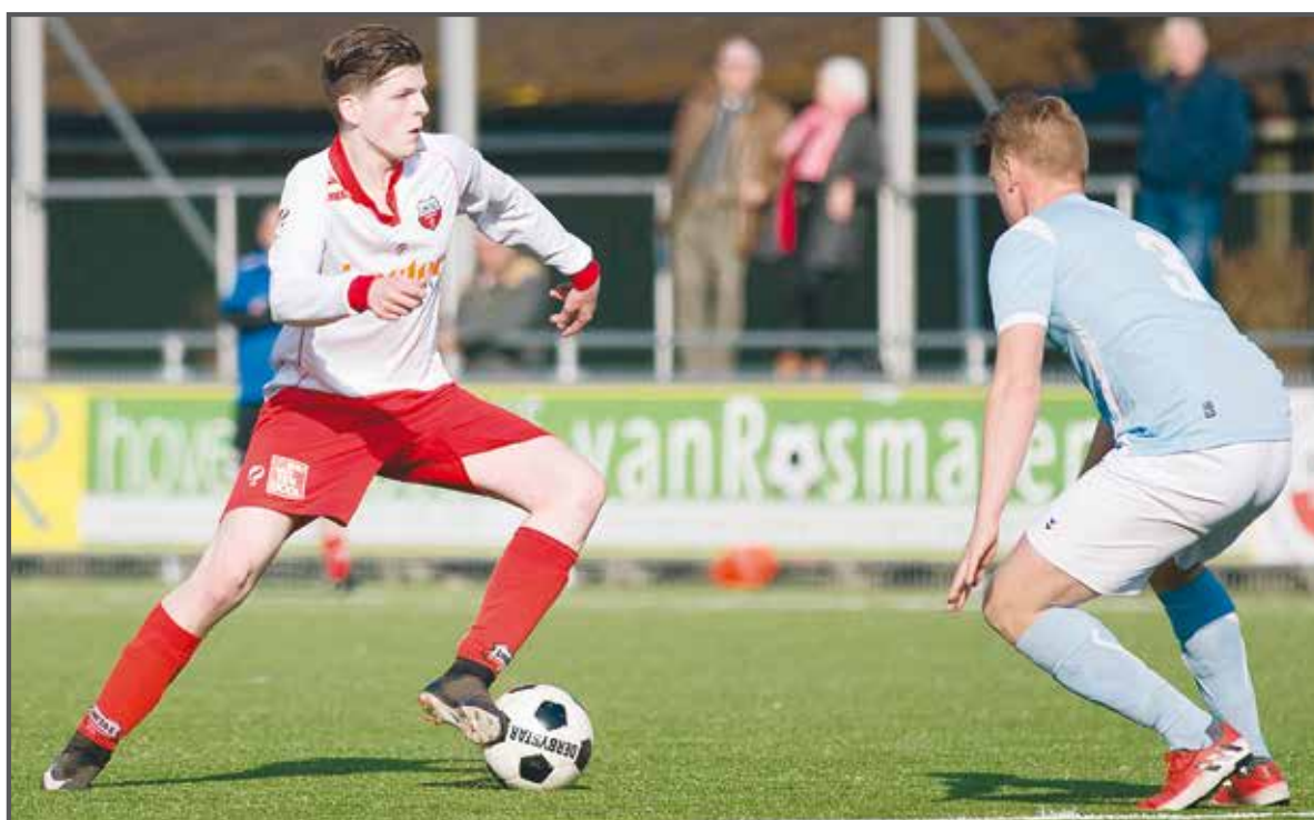
'Het is een mooie uitdaging om voor Unitas zondag te gaan'