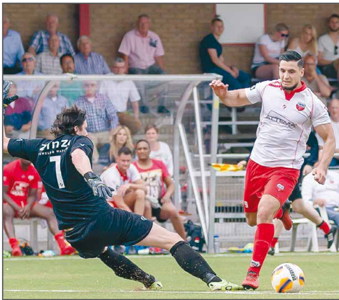
'Ik wilde naar een regio waar ik me zelf weer moest bewijzen.'

Dat hij dat jaar zijn doelpuntenmachine afvuurde in de A1 van OJC was mede te danken aan het feit dat hij moest afhaken bij RKC/Willem II. „Ik was gewoon clubtopscorer. We speelden tegen Memphis Depay, Tony Vilhena, Karim Rekik en ik hielp m'n team aan goals. Maar toen mocht ik niet over naar de A. De trainer koos voor een middenvelder die hij wilde omvormen tot spits. Ik was heel teleurgesteld. Ik kon daarna naar FC Den Bosch, maar ik had er geen trek meer in om zes keer per week te voetballen.”