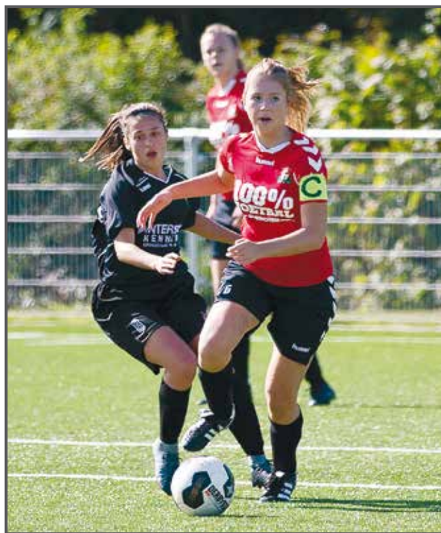
'Bij Sliedrecht ben ik één keer kampioen geworden, het wordt wel weer eens tijd'