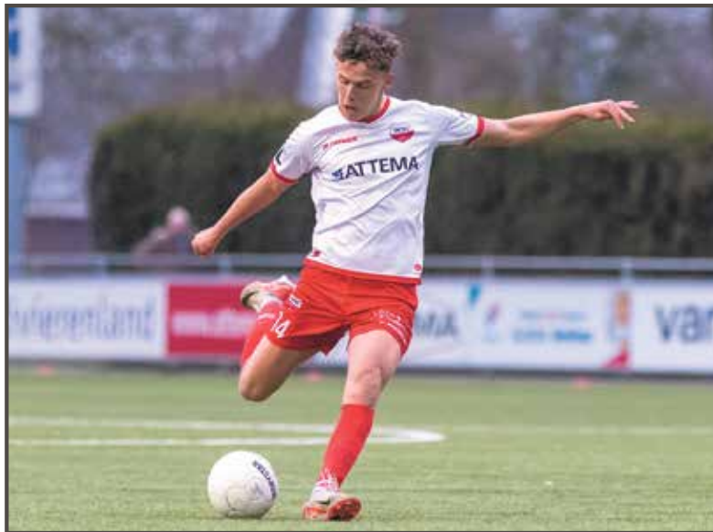
'Ik ben mentaal al sterker, maar het is nog steeds niet top'