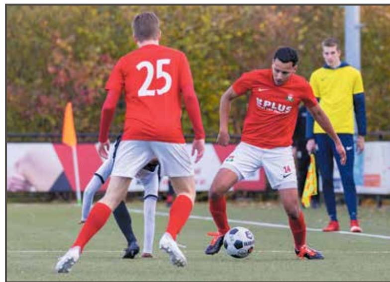
'Relativeren is wat makkelijker geworden'

„Kort gezegd maakte mijn lichaam na de eerste operatie te veel litte-