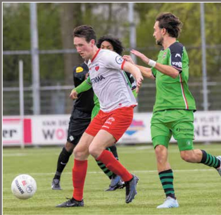
'Ik heb wel gedacht: dit ga ik volgend jaar niet meer doen'

„Ik vind het niet echt nodig om te zeggen waar ik over drie jaar wil zijn. Dat weet ik nu nog niet. Ik kijk meer naar de korte termijn: hopelijk spelen we volgend jaar gewoon weer met een leuk team in de Derde Divisie.”