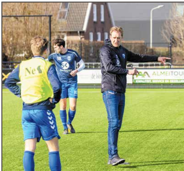
'Ik focus op de jongens die er wel zijn'

„Ik vond ons een beetje bleu. We lieten alles maar over ons heen komen en kreeg niet het idee dat we speelden om te winnen. De derby tegen Meerkerk kwam op een