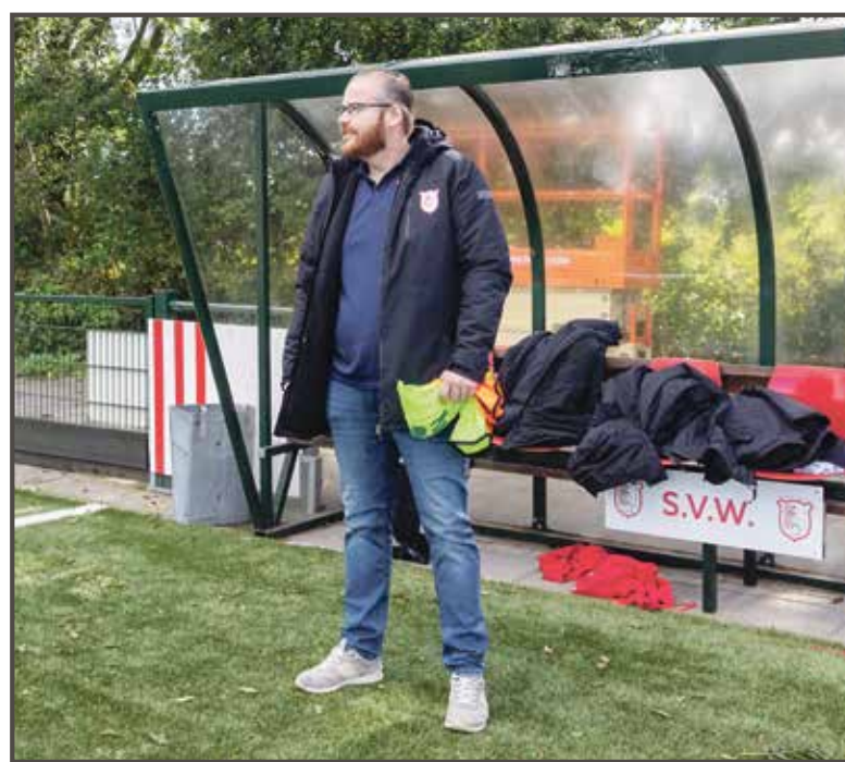
Daar staat hij dan: corona maakte hem van super supporter tot teammanager bij SVW

Hoewel hij zelf stopte, nam hij nooit afscheid van SVW. „Lekker na de wedstrijd bij het eerste kijken, dat deed ik altijd al. Vanaf het seizoen